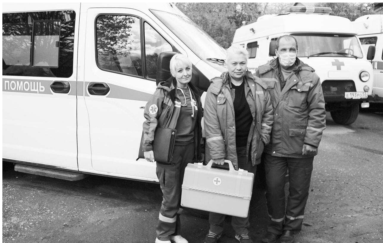
Фельдшеры, медсёстры и водители Боровичской станции скорой медицинской помощи дополнительные стимулирующие выплаты за апрель уже получили

По материалам пресс-центра правительства области.