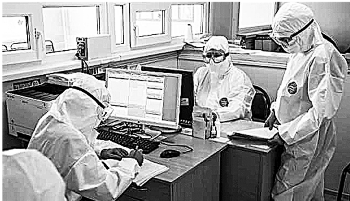
В настоящее время сформирован кадровый резерв хирургов — для работы со сложными пациентами с коронавирусом

Людмила ДАНИЛКИНА.