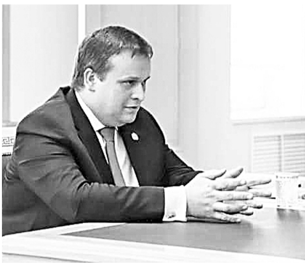
Андрей Никитин: «Наша жизнь изменится, но никто сейчас достоверно не скажет, как»

— Наверное, сейчас вам никто не скажет достоверно, как всё изменится. Можно посмотреть на опыт стран Юго-Восточной Азии, где было несколько эпидемий, достаточно серьёзных, которые были связаны с подобными историями. Огромное количество людей при ма-